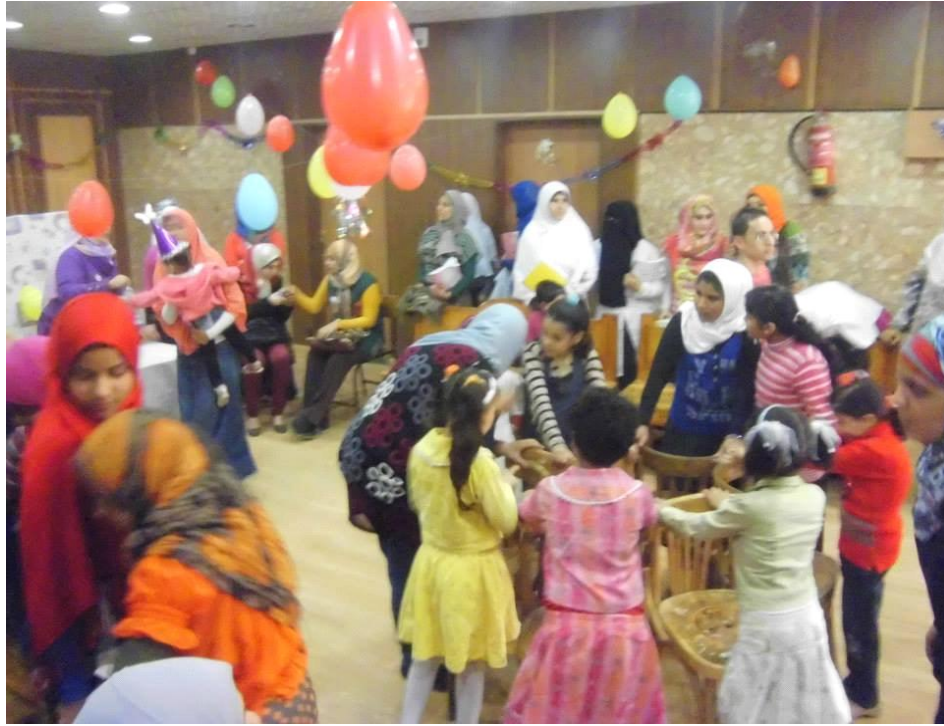
عمل شئطة رمضان 2015-2016