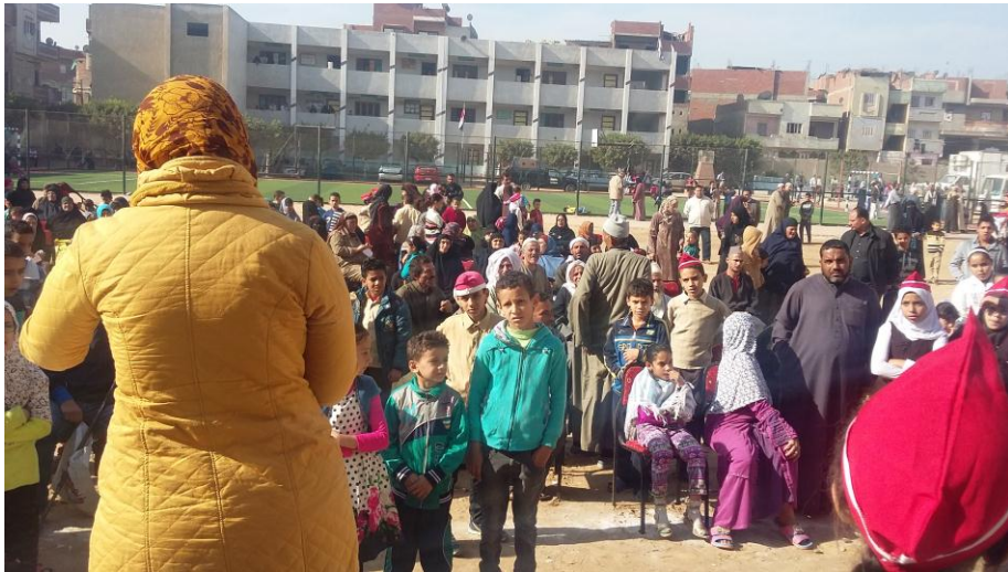
القافلة الطبية المتجهه الى قرية كفر سعدون مركز قطور يوم الاثنين الموافق 2017/1/30