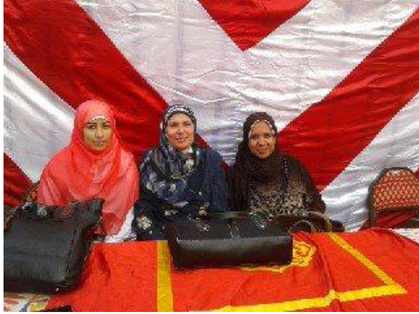
قافلته الطبيه متجهه الى بسيون و القرى و المراكز المجاوره المقرر عقدها في 2016/11/29